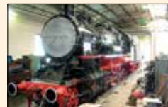
Die Wartung der historischen Fahrzeuge ist sehr teuer und aufwändig.

1969 machten sich in Ulm/Donau einige Eisenbahnfreunde Gedanken über die Erhaltung von historisch wertvollem Eisenbahnmaterial. 1971 kam es dann zur Gründung des Vereins der Ulmer Eisenbahnfreunde e. V. Die bundesweit über 600 Mitglieder betreuen heute 10 Dampflokomotiven, einige andere Triebfahrzeuge und mehrere Dutzend Wagen. Viele wurden in mühevoller Arbeit restauriert und repräsentieren heute einen breiten Querschnitt historischer Eisenbahnfahrzeuge. Die meisten Fahrzeuge sind betriebsfähig und werden bei regelmäßigen historischen Dampfzugfahrten und bei Sonderfahrten in fast ganz Europa eingesetzt.